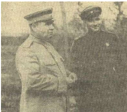
На Воронежском фронте 1942г.

Апанасенко фактически самостоятельно формировал и выдвигал на границу дивизии и