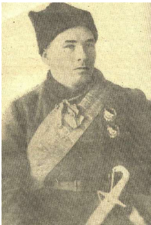
Командир- комиссар Ставропольской кавалерийской дивизии им. Блинова И.Р. Апанасенко